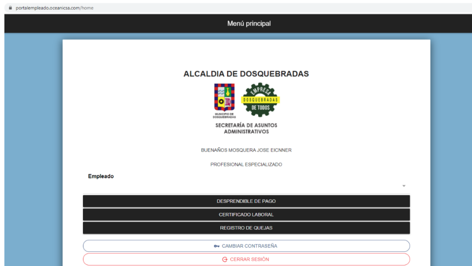
Figura No. 3 – Menú Principal Portal

Conforme el servicio requerido, se debe elegir la respectiva opción. Es importante, siempre, cerrar la sesión tan pronto se haya utilizado la plataforma.